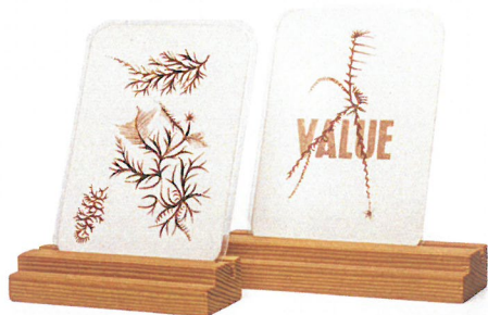
אורי קצנשטיין, קלפים, 2008, 30 קלפים, (עטופים בלמינציה) רישומי דם, טכניקה מעורבת 7/9.5 ס"מ