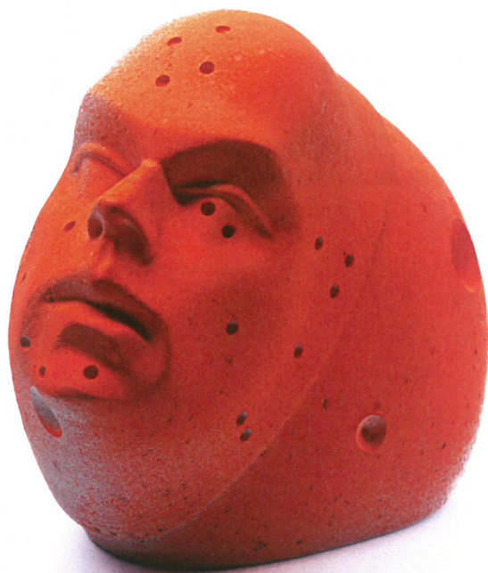
אורי קצנשטיין, ראש, 2014, יציקת גבס צבועה, 15/10/13 ס"מ