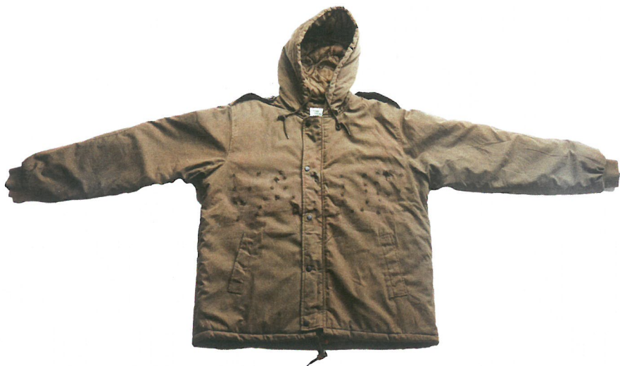
אורי קצנשטיין, Value, 2012, כיתוב בעזרת ירי על מעיל דובון באמצעות 470 כדורים קטומים בקוטר 0.40 קליבר